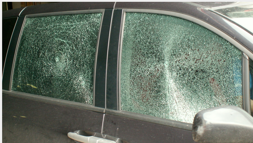
Biztonsági fóliázott üveg ablakbetörés után

A gépjármű-lopásokat egy későbbi számunkban beszéljük majd át.