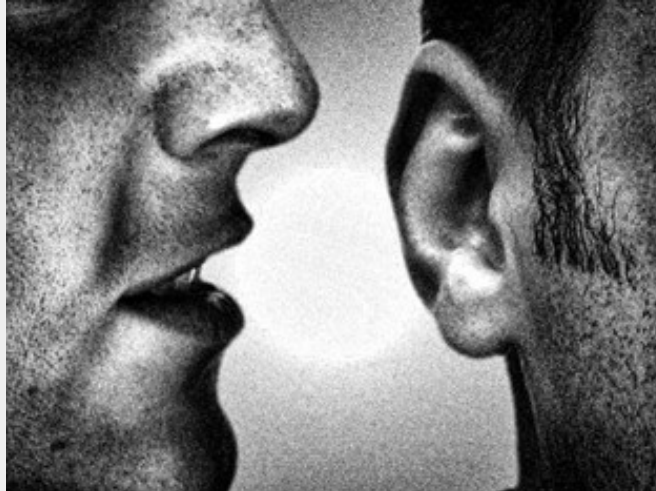
Az informátorok mindenütt ott voltak

támaszkodott a ma csak „besúgóknak” nevezett informátori hálózatra, melynek tagjait (akik jöhettek az élet bármely területéről) zsarolással, vagy megvesztegetéssel, de mindig az informátor felajánkozásával, „önként” toborozták. (még ha valójában nem így volt, akkor is) Fontos megjegyezni, hogy az 1956 utáni politikai rendőrségnek nem volt feladata (mint 1956 előtt az ÁVH-nak) minél nagyobb számú ellenséges elem létezésének „bebizonyítása”, sokkal inkább a már ismert, valóban rendszerellenes személyek és csoportok szoros megfigyelése, így a mennyiségi helyett, a minőségi munka került előtérbe.