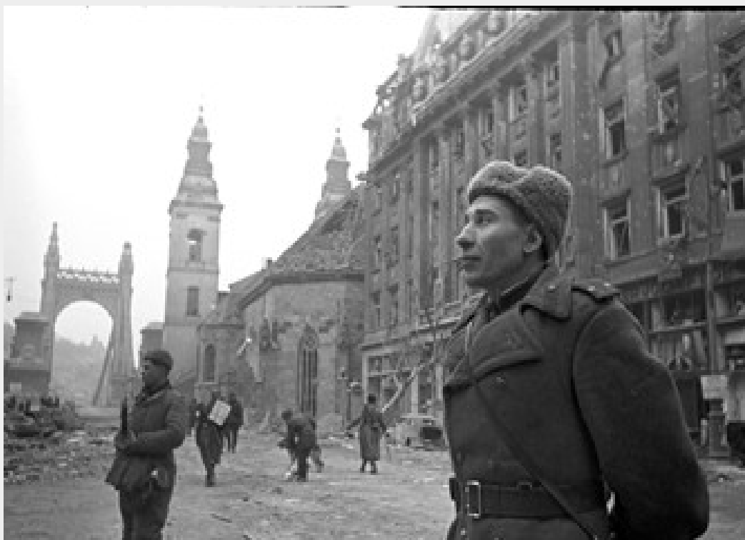
Szovjet katonák 1945-ben Budapesten. 45 éven át maradtak.

A rendőrség számos esetben működött együtt a Magyar Népköztársaság többi fegyveres testületével (BM Határőrség, Munkásőrség, Néphadsereg) például állami rendezvények biztosítása, összehangolt közúti ellenőrzések (razziák), vagy kiemelten veszélyes, fegyveres bűnözők, szökevények elfogásakor. Erre több példa is akadt, ugyanis az „ideiglenesen” Magyarországon állomásozó Szovjet Hadsereg katonái, honvágyból, vagy az embertelen körülmények elől menekülve (a Szovjet Hadseregben mindennaposak voltak a kegyetlen testi fenyegetések, embertelen kiképzési feladatok, így ébren tartva a szovjet kiskatonákban a harci morált) gyakran kíséreltek meg hajmeresztő szökéseket. Tették ezt nem egyszer felfegyverkezve, ittasan, vagy éppen harcjárműveket ellopva, mint 1978. október 8-án, amikor egy részeg szovjet katona Bócsáról (Bács- Kiskun megye) ellopott, páncélozott szállító harcjárművével, 110 kilométeres sebességgel behajtott a 4-es főúton Debrecen felől érkező forgalomba, és négy szabályosan közlekedő fiatal kerékpárost is elgázolt, akik közül kettő a helyszínen szörnyethaltak. Az üldözést végül harckocsik és helikopterek bevetésével zárták le, ebben az akcióban, a helyszínelést, és a forgalom elterelését szintén a magyar rendőrség végezte, együttműködve a Szovjet Hadsereggel.