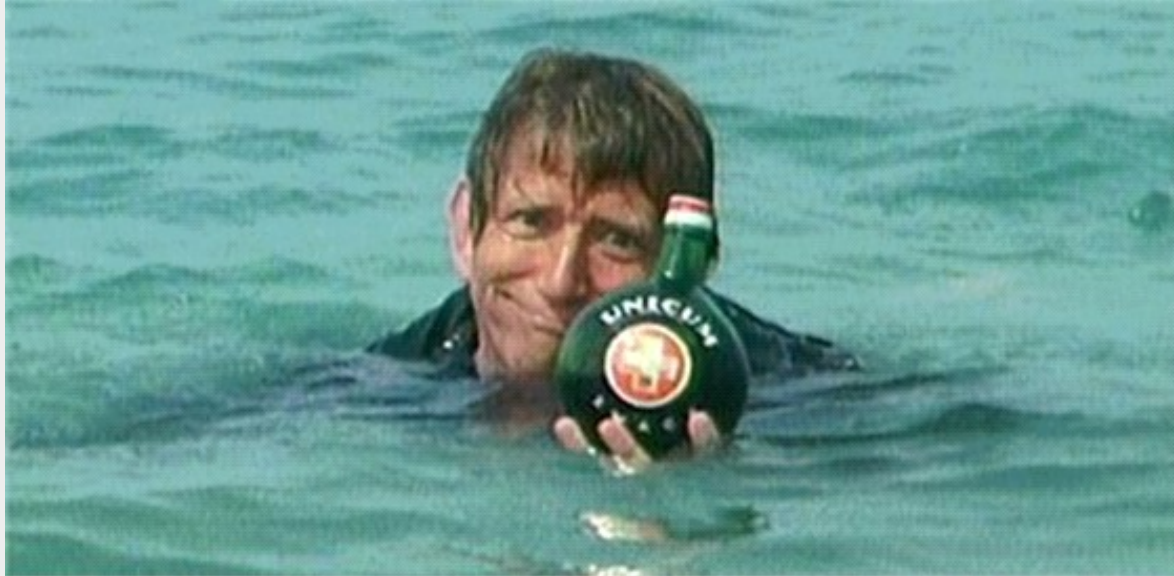
Nem minden balatoni szolgálat járt ilyen izgalmakkal a rendőrök számára – részlet a Pogány Madonna c. filmből. (1980)