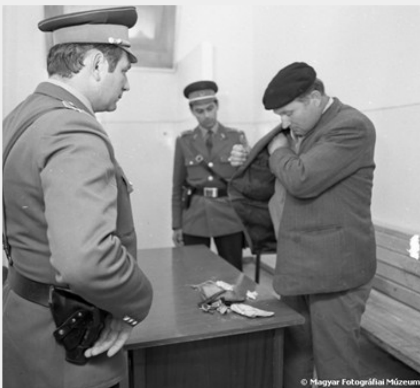
Rendőrök igazoltatás közben. Elegancia, és kényelmetlenség.