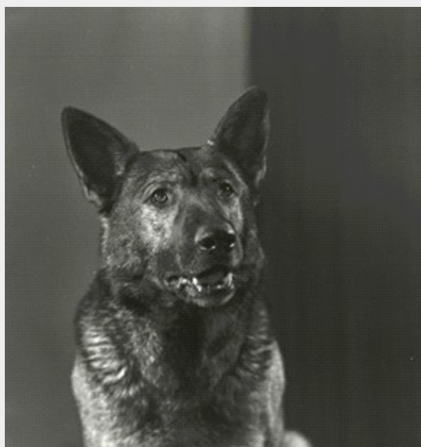
Kántor, a legendás nyomozókutya

Kántor életéről Szamos Rudolf írt kétrészes könyvet ( Kántor Nyomoz és Kántor a Nagyvárosban címmel), melyből 1976-ban Nemere László rendezésében, Kántor címmel ötrészes tévésorozatot is készítettek. Kántor kitömött teste ma a Rendőrség-történeti múzeumban (Budapest, Mosonyi utca 5.) tekinthető meg.